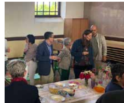
Pot de l'amitié après le baptême - 9 juin 2024