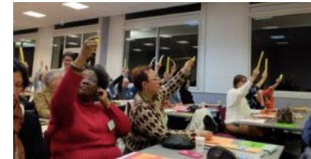
Vote des synodaux à Angers

Finances : vote du budget prévisionnel 2025 qui engage les paroisses sur leurs contributions annuelles et sur le versement exceptionnel de 5% des sommes détenues sur les comptes bancaires afin d'assurer des recettes suffisantes face à l'ensemble des dépenses.