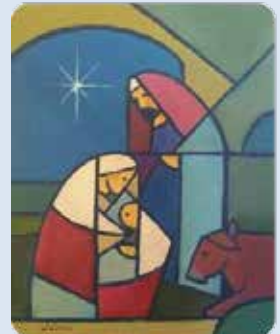
Jorge Cocco Sant'angelo ©