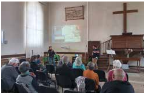
Événement « déchets d'œuvre »

Cet automne au Temple de Saint Sauvant, il y eut notamment :