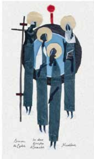
Sur le chemin d'Emmaüs