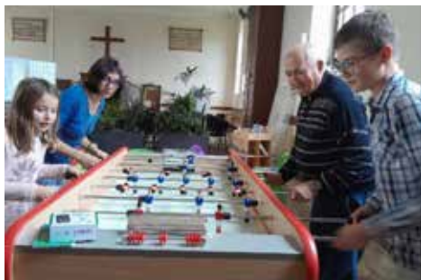
Des jeunes en pleine action le 10 novembre à Saint Sauvant !