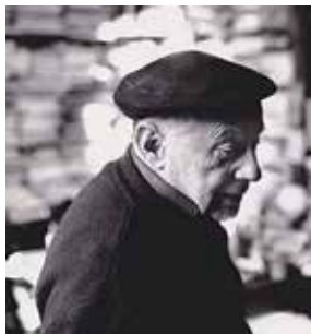
Jacques Ellul