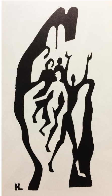
Henri Lindegaard © - La bible des contrastes

Comment rendre témoignage de la Parole ? Comment témoigner et entamer une conversion les uns avec les autres sans pour autant rendre le témoignage stérile ? Comment rentrer en dialogue avec autrui en tenant compte de nos différences et de la pluralité des nos convictions sans pour autant céder à la tentation de vouloir posséder le Chemin ? Basés sur une interprétation fondée sur la Parole, donc de l'Amour, prenons ensemble le chemin qui nous conduit à la Vie de l'homme de Nazareth.