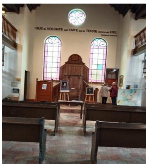
Le temple musée de Lemé

Après le repas préparé par la paroisse locale, Evelyne nous fait visiter le temple-musée de Lemé dont elle est la fondatrice.