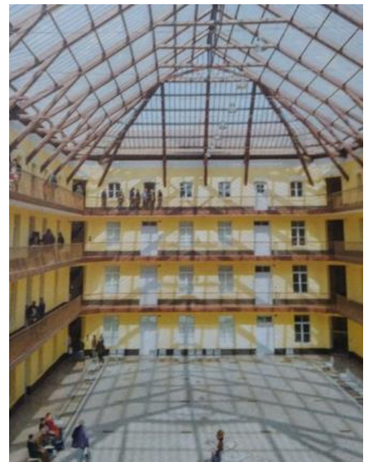
Le familistère de Guise

Le temps fort du lundi est consacré à la visite du fameux familistère de Guise où J-B Godin (fabricant de poêles en fonte) fait bâtir de 1859 à 1884 une cité modèle, interprétation originale du phalanstère de Fourier.