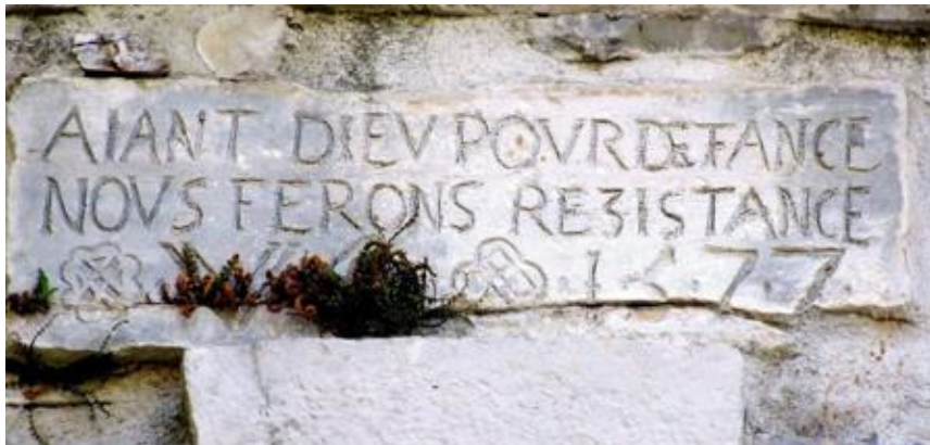
photo prise à Sumène en 2013, à la porte de la ville. « Ayant Dieu pour défense, nous ferons résistance ». (inscription huguenote)