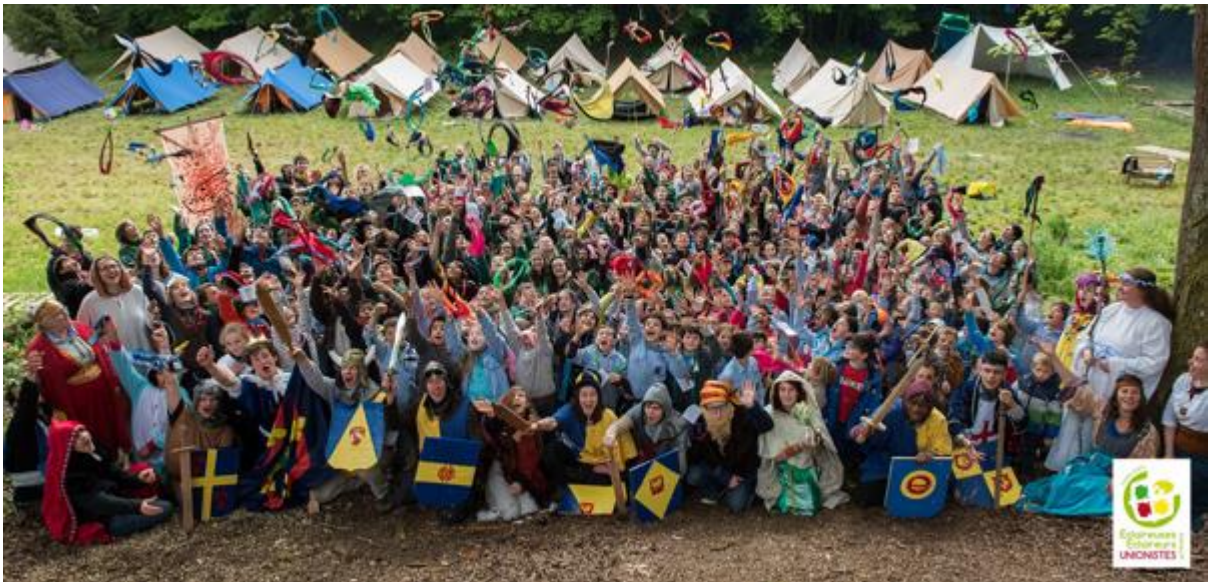
Dernier rassemblement régional EEUdF, en mai 2016

Les grands éclaireurs, ceux âgés de 14 à 16 ans qui constituent la guilde, ont été les premiers à replanter les tentes ! Ils ont passé 4 jours dans les Pyrénées et ont vécu un camp itinérant mémorable lors des vacances d'avril. Le prochain grand événement campé sera le rassemblement régional qui aura lieu à Lusignan les 4-5-6 juin. La dernière édition avait eu lieu en mai 2016 près de Poitiers alors après 6 années nous serons heureux de retrouver tous les EEUdF de la région : Tours-Orléans-Bourges-Poitiers-La Rochelle-Les Îles de Saintonges-Nantes-Renne Porte de Bretagne et nous Melle-Sud-Deux-Sèvres ! L'occasion de réunir tous les membres du mouvement enfants, responsables, cadres et « parents-coup de main » autour d'activités scoutées et de moments festifs.