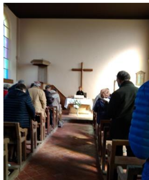
Le culte à la Censé des Nobles

Le culte dominical, présidé par la pasteure Corinne Nême-Peyron, se déroule dans le temple de « la Censé des Nobles », près de Landouzy.