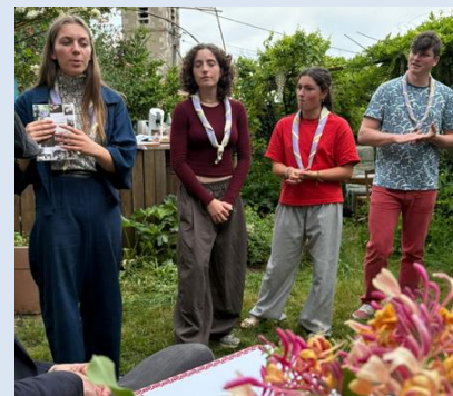
L' quipe et son responsable

Le 10 mai dernier, l' quipe a n e des « Ain stimables » a rendu son t moignage sur ses deux ans de projets   la d couverte de mode de vie alternatifs en France et en Allemagne,   la maison Broche   Lusseray, pr s de Melle.