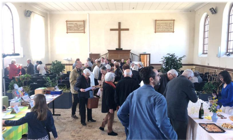
Moment festif lors du culte du 6 avril 2025