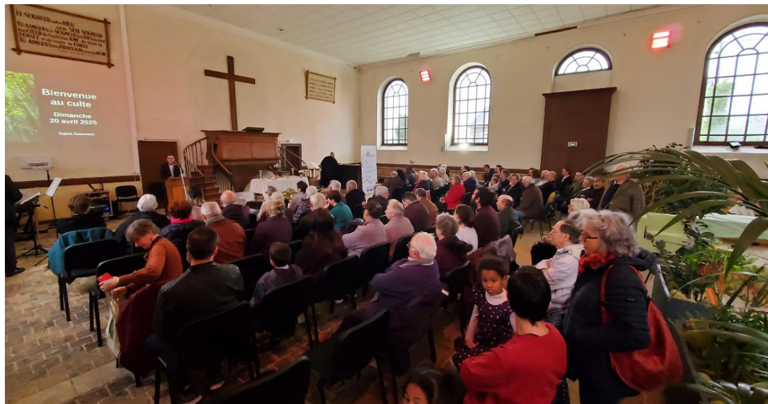
Une assemblée plus que nombreuse pour ce beau culte de Pâques !