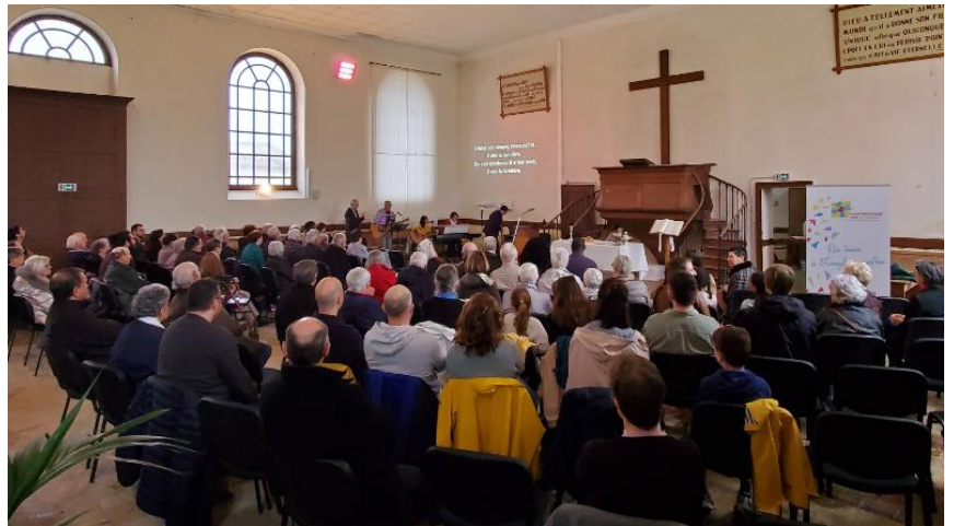
Au culte de réconfort pour les familles touchées par le deuil