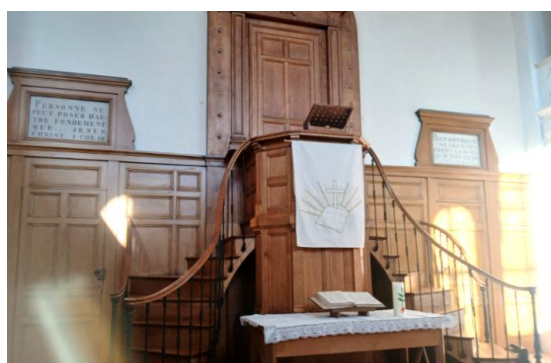
La belle chaire du Temple de Castelmoron

Dimanche matin, culte au temple de Castelmoron, joli petit temple, à peine assez grand pour accueillir tout le monde. À la sortie du culte, le verre de l'amitié et de la fraternité nous était offert par les paroissiens.