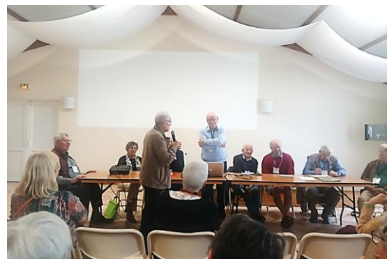
Lors des débats et échanges du MAR