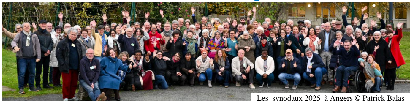
Les synodaux 2025 à Angers

Le sujet synodal « L'Église universelle » a été discuté en plénière et en groupe : « Que signifie dans notre vie d'Église locale, de paroisse, la conscience d'être une partie d'un corps plus vaste que nous nommons l'Église universelle ? Comment cette conscience conduit-elle ou modifie-t-elle notre manière d'être Église ? Ce sujet a de nombreuses ramifications. Il touche à la fois à l'accueil que nous faisons localement de la diversité, aux relations que nous entretenons avec les autres Églises, en France et dans d'autres pays. Il concerne également les liens avec les services, les communautés et les organismes internationaux dont nous sommes membres ».